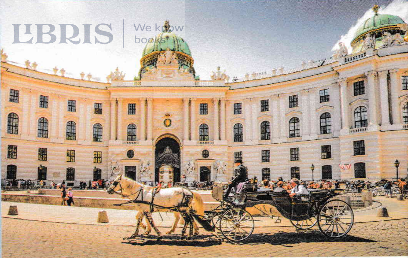
Alte Hofburg ↑

heurigers - în care se servea vinul orașului. Această cultură specială a fost recunoscută de UNESCO în 2019, când scena viticolă a Vienei s-a adăugat listei patrimoniului său cultural intangibil.